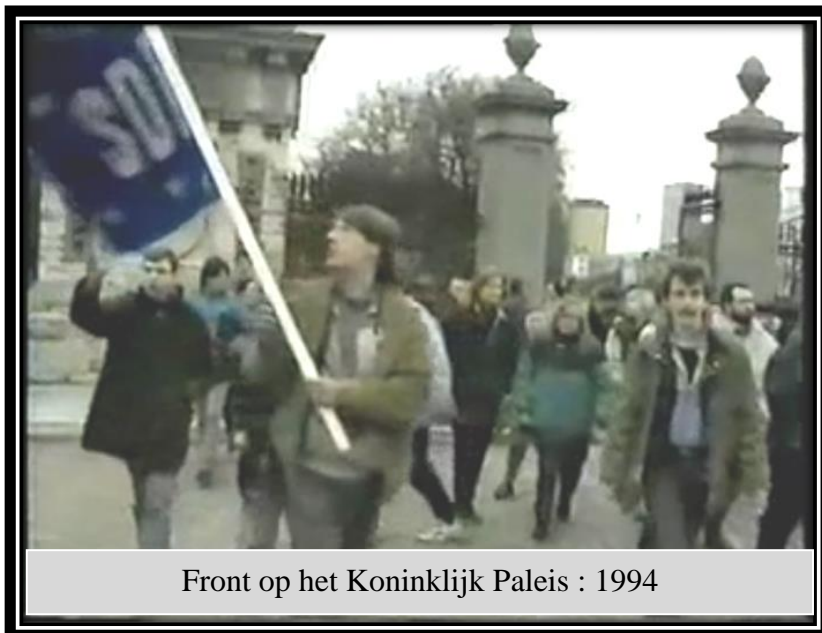
Front op het Koninklijk Paleis : 1994

De reden waarom de gemeentes meer en meer meewerkten en dat er bezoekers kwamen met voedsel en andere vormen van aanmoediging was de correcte manier waarop de cavalcades verliepen: orde, netheid, respect voor de personen.