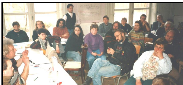
Internationale bijeenkomst : 150 deelnemers

Het geduld heeft zijn grenzen. Om de politiciers tot actie te dwingen, begonnen enkele aanvoerders met een hongerstaking . Een staking