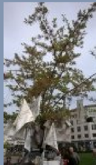
L'arbre près de la gare centrale Bxl