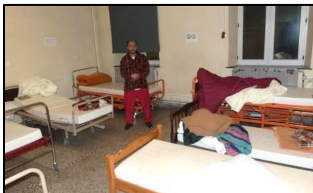
Soleil d'hiver à Arlon

caserne de Seraing qui peut accueillir près d'une trentaine de personnes. En tout environ une petite centaine de places en cas de tout grand froid